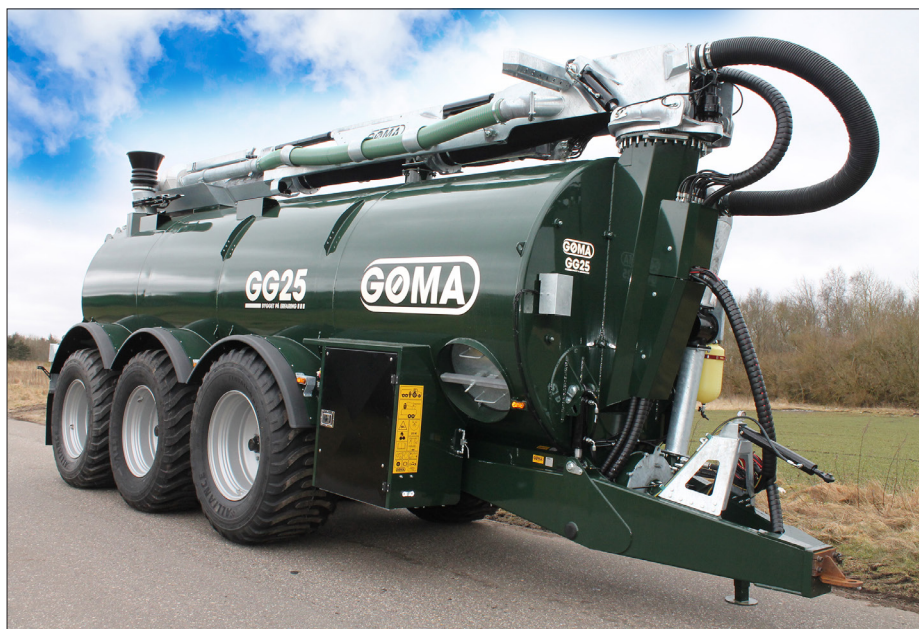
GØMA har selv udviklet og produceret gyllevogne siden efteråret 2017. De nye gyllevogne har fået betegnelsen GG og leveres foreløbigt i 15, 18 og 25 kubikmeter.